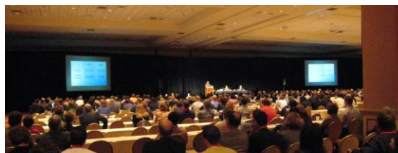
図2に米国の「州裁判所ナショナル・センター」主催の電子法廷に関する公開講演会「e-COURTS2006」の様子を示す。

ワシントン州キング郡ではベンダーのシステムに依存しないで、XML(eXtensible-Markup-Language)を司法手続向けに発展させた legal-XML に準拠して、裁判所の職員が電子ファイリング・システムを開発・構築したものである。XML に準拠しているとのことであり、広範囲の汎用性が見込まれる。