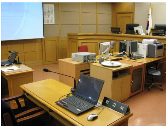
図6 代理人席から見た電子法廷(代理人も画面を操作できる)

我が国の裁判は、公開法廷で審理されるものの、審理中に、裁判官が準備書面のどの部分を問題にしているか、傍聴人が理解することは不可能である。韓国の電子裁判手続では、裁判官が法廷の大スクリーンに映し出された準備書面を示しながら審理をするので、第何準備書面の何ページのどの主張について審理されているの