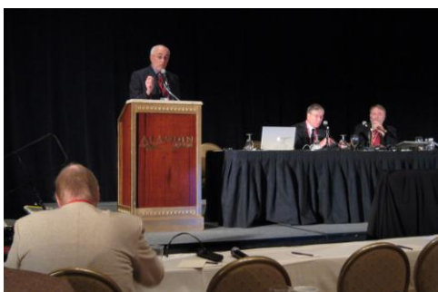
図1 デラウェア州最高裁判所判事 ヘンリー・デュボン・リジリー氏

より事態は改善される。電子ファイリングが義務化された上訴審においては様々な変化が表れた。オンライン化は今後も進展する。紙の書類が徐々に減り、コピー枚数も減る。電子ファイリング・システムは将来、事件管理システムと連携して、電子のビジネス世界へ繋がることになる。」と語っている（図1）。