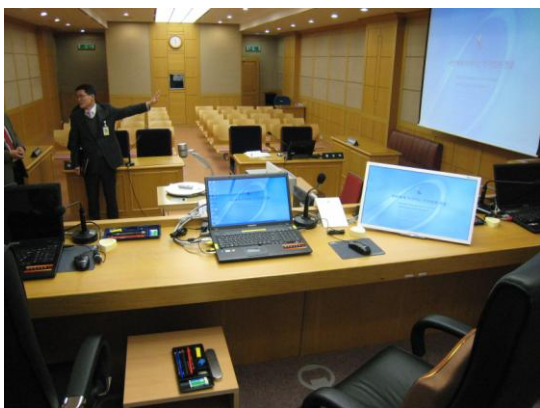
図5 電子法廷の全体風景(傍聴席から見える大きなスクリーン、法廷中央にはオーバーヘッド・カメラ) 日弁連「韓国「電子裁判」調査報告書」より

で表示される。残りの中央部の1/2のスペースには、原告あるいは被告の提出書類リストから引き出された書面が大きく表示される。裁判官も代理人も法廷にいる傍聴人もそのスクリーンに表示された、訴状、準備書面、書証などの訴訟記録を見ることができる(図5、図6)。