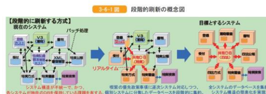
図7（特許庁行政年次報告書2013年版より）

わが国の特許庁にみる「ペーパーレス計画」の先進性とその挫折は、司法の電子手続を進めるにあたって、他山の石としなければならず、その轍を踏むことのない慎重さと大胆な決断が必要である。