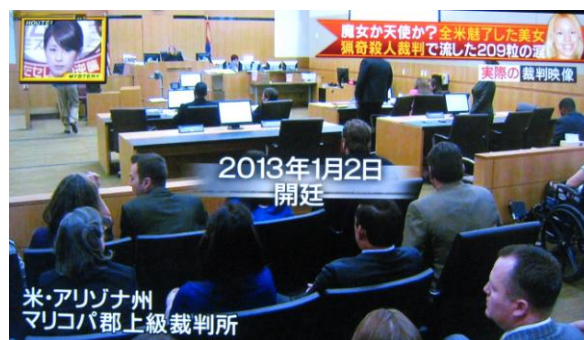
図3 2013年8月31日フジテレビ「世界法廷ミステリー3」より

続においても電子裁判手続を採用したものであるが、最近、その法廷風景がフジテレビの「世界法廷ミステリー3」で放映された。電子化された刑事裁判の審理風景である(図3)。映像画面からは分かりづらいが、裁判官席、検察官席、弁護人席にはそれぞれのディスプレイが置かれている。法廷へ提出された証拠物は、法廷中央に置かれたオーバーヘッド・カメラ(映像画面にはオーバーヘッド・カメラの上部カメラ部分が写っている。)で撮影され記録される。弁護側提出の音声データはCDプレーヤーで再生される。オーバーヘッド・カメラは法廷に提出された証拠物をその場で記録し電子化するための必須ツールであり、韓国の電子法廷(後出)等においても設置されている。